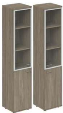
Шкаф высокий со стеклом 2-х дверный л/п

WN.702.OL L/R 400x400x1955 WN.702.OD L/R 400x400x1955