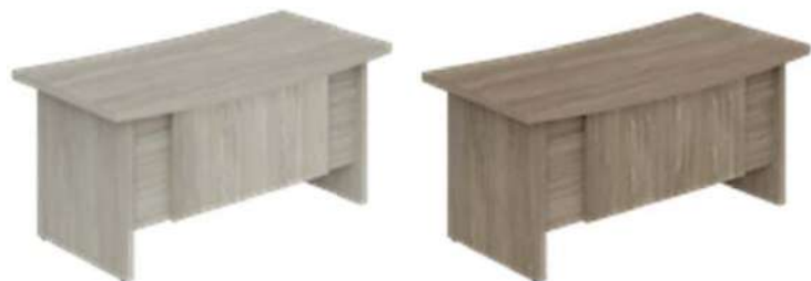
WN.101.OL 1600x847x750 WN.101.OD 1600x847x750