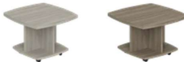
WN.602.OL 800x800x550 WN.602.OD 800x800x550