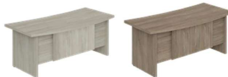
WN.102.OL 1800x847x750 WN.102.OD 1800x847x750

Дизайн стола подчеркивается уникальной формой столешницы и двумя передними панелями, направление текстуры которых расположено относительно друг друга под углом 90 градусов. Столешница и опоры изготовлены из ЛДСП толщиной 41 мм, полученной путем склеивания плиты толщиной 16 и 25 мм.