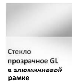
Стекло прозрачное GL в алюминиевой рамке