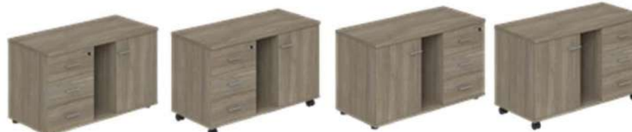
WN.203.OD L/R 1004x462x581