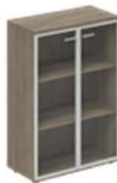
Шкаф средний со стеклом 2-х дверный

WN.801.OL 800x400x1200 WN.801.OD 800x462x1200