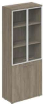
Шкаф высокий со стеклом 4-х дверный

WN.701.OL 800x400x1955 WN.701.OD 800x400x1955