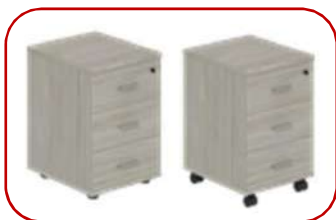
WN.201.OL 404 462x581