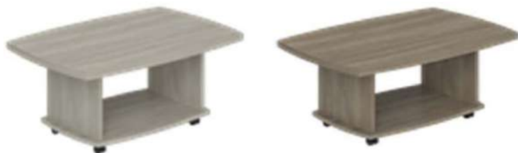
WN.601.OL 1200x800x550 WN.601.OD 1200x800x550