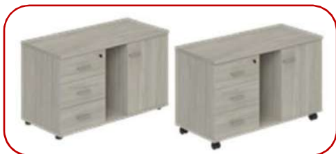
WN.203.OL L/R 1004x462x581