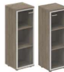
Шкаф высокий со стеклом 1-но дверный л/п

WN.802.OL L/R 400x400x1200 WN.802.OD L/R 400x400x1200